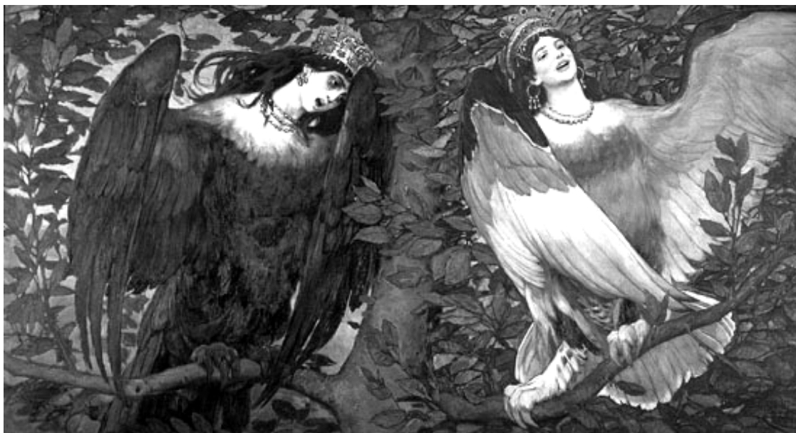
Си́рин и Алконо́ст. Песнь радости и печали. Худ. Васнецов В.М.1896