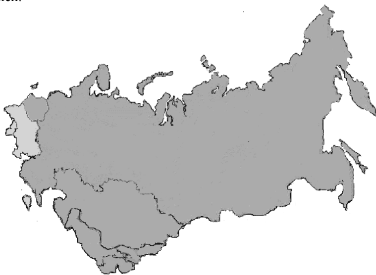
Рис. 3. Евразийское экономическое сообщество. Темно-серым цветом выделены государства – члены ЕврАзЭС: Россия, Белоруссия, Казахстан, Киргизия, Таджикистан, Узбекистан (членство приостановлено в 2008 г.); светло-серым цветом выделены государства – наблюдатели: Армения, Молдавия, Украина

Некоторые интеграционные механизмы вообще зарождались как двухсторонние инициативы. Например, франко-германский военный корпус, в определенной степени проложивший дорогу к формированию общей политики ЕС в вопросах безопасности. Другие инициативы выдвигались группой стран, например, Шенгенское соглашение об отмене пограничного контроля. Интеграционные мероприятия в рамках ЕС не всегда точно соответствуют географическим рамкам сообщества, что не мешает реализации основного принципа – интеграция носит добровольный характер, и в ней участвуют только те, кто реально готов к ней.