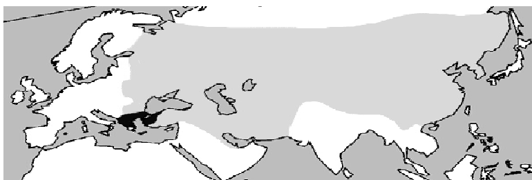
Рис. 2. Монгольская империя (выделена светло-серым) и Византия (выделена черным) в 1288 г.

Народы Евразии неоднократно создавали различные объединения. Еще до нашей эры существовал скифско-скифский союз, который объединял Евразию, потом он уступил место Великому тюркскому каганату, существовавшему в VI–VII в. н. э. и охватившему земли от Желтого моря до Черного. На смену тюркам пришли из Сибири монголы во главе с Чингисханом. Затем инициативу взяла на себя Россия: с XV в. русские двинулись на восток и вышли к Тихому океану. Российская империя выступила, таким образом, «наследницей» Тюркского каганата и Монгольской империи, и, в свою очередь, уступила место Советскому Союзу.