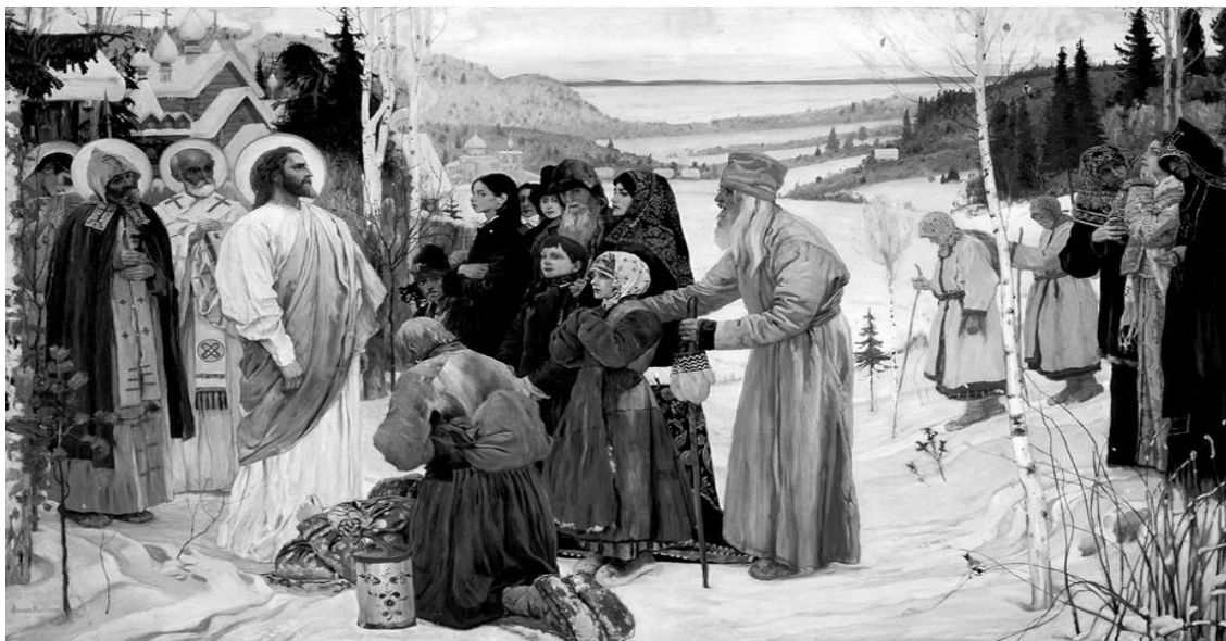
Святая Русь. Худ. Нестеров М.Н. 1901–1906