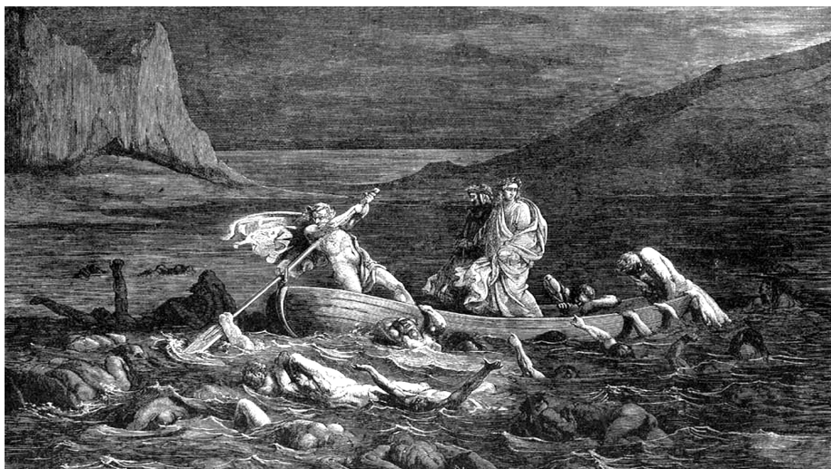
Переправа через Стикс (илл. к «Божественной комедии» Данте»). Фрагмент. Художник Гюстав Доре. 1860-е гг.