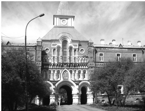
Приморская Троице-Сергиевая пустынь в Стрельне (братский корпус). Архитектор А.М.Горностаев (1808–1862). Верхний снимок – худ. открытка из собрания филокартиста Н.П.Шмитт-Фогелевича, изд. Международного Благотворительного Фонда «Константиновский». Нижний снимок – Братский корпус в мае 2010 г. Фото автора.

Принц Петр Георгиевич стал инициатором и первым председателем основанного в С-Петербурге «Русского общества международного права» (1880), выступал как последовательный сторонник разоружения и уничтожения войн. Не чужд был изобретательской деятельности, например, в Российской национальной библиотеке хранится его описание нового ранца 2 . На Большой Морской улице у него была мастерская, где принц экспериментировал с гальваническими элементами, занимался гальванопластикой. И не только экспериментировал, но, по сути, организовал серийное производство. Здесь были созданы ангелы для Исаакиевского собора и почти 150 «букетов» имитирующих акант, которые были установлены как завершение плоских колонн на доме министра государственных имуществ 3 . Как старший из кавалеров 1-й ст. ордена Св. Владимира председательствовал в Кавалерской думе ордена (с 1867 г.). Автор стихов 4 , переводов стихотворений и баллад И.Ф.Шиллера и музыки (сегодня его мелодии звучат в одной из сцен балета «Корсар»), был лично знаком с А.С.Пушкиным и перевел на французский язык его «Пиковую даму». Как председатель комитета по сооружению памятника поэту возглавлял торжества по случаю его открытия в 1880 г.