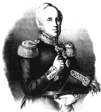
Принц Павел Петрович, Великий герцог Ольденбургский. Портрет из коллекции Эрмитажа.

Во время краткого царствования Петра III двоюродный дядя императора, Герцог Гольштинский и Шлезвигский Георг-Людвиг (George-Ludwig, 1719–1763), был вызван в Россию. В феврале 1762 г. он был назначен генерал-губернатором Гольштейн-Готторпских земель, перешедших во владение российской короны, пожалован званием генерал-фельдмаршала и назначен шефом лейб-гвардии (далее – Л.-Гв.) конного полка. В мае в его честь был назван новый корабль русского флота. Поскольку во время дворцового переворота герцог Георг остался верен императору, его арестовали, но вскоре освободили и назначили штатгальтером Гольштинии, куда он и вернулся.