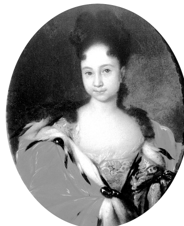
В.Кн. Анна Петровна, родоначальница Великих герцогов Ольденбургских. Портрет худ. И.Никитина. XVIII в.

В 1725 г. дочь первого российского императора Петра I Анна (1708–1728) вышла замуж за герцога Голштинии Карла-Фридриха. Три года спустя, в Киле родился их сын Карл (Петр Федорович; Carl-Peter-Ulrich, 1728–1762), будущий российский император Петр III. После рождения сына Анна Петровна прожила менее месяца, скончавшись от «скоротечной чахотки и родовой горячки». Гроб с ее телом российский фрегат «Крейсер» доставил в Санкт-Петербург, где Анна Петровна была похоронена в Петропавловском соборе рядом с родителями. В память о скончавшейся супруге герцога Голштейн-Готторпский Карл-Фридрих учредил придворный орден Св. Анны (1735) четырех степеней. В 1738 г. сын умершей цесаревны, ставший Императором, «переселил» орден в Российскую империю, возведя его в ранг государственной награды. Строго говоря, с момента воцарения Петр III