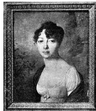
В.Кн. Екатерина Павловна Романова, принцесса Ольденбургская, королева Вюртембергская. Миниатюра Фредерика Дюбуа. Конец XVIII – начало XIX вв.