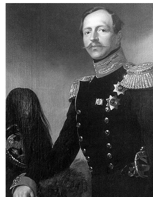
Принц П.Г.Ольденбургский в мундире Л.-Гв. Преображенского полка. Портрет кисти художника Жозефа-Дезире Кура, 1842.