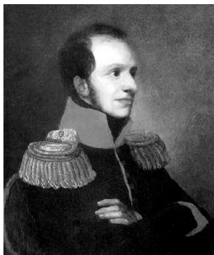
Принц Георгий Петрович. Портрет кисти О.А.Кипренского, 1811. В каталогах значится как портрет герцога Г.Ольденбургского

Рано оставшиеся без отца Гольштинские герцоги 1 Вильгельм (Wilhelm-August, ?–1774) и Петр (Peter-Friedrich-Ludwig, 1755–1829) воспитывались в России под опекуном императрицы Екатерины II (1729–1796). Оба поступили на русскую военную службу. Герцог Вильгельм выбрал флот, но вскоре утонул в Ревельской бухте. Герцог Петр служил в армии и участвовал в русско-турецкой войне 1768–74 гг. В 1781 г. он женился на вюртембергской принцессе Фредерике (1765–1785), младшей сестре будущей российской императрицы Марии Федоровны (1759–1828). В 1785 году его назначили администратором Ольденбургского герцогства, а в 1823 г. он стал Великим герцогом. У супругов было двое сыновей: Павел Петрович (Paul-Friedrich-August, 1783–1853) и Георгий Петрович (Peter-Friedrich-George, 1784–1812). В ходе наполеоновской войн герцогство Ольденбургское было занято французскими войсками. Оба мальчика, к этому времени успевшие окончить Лейпцигский университет, отправились в Россию.