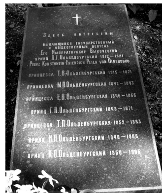
Место, где в Троице-Сергиевой пустыни находилась усыпальница Ольденбургских (слева), и поминальный камень (справа). Май 2010 г.