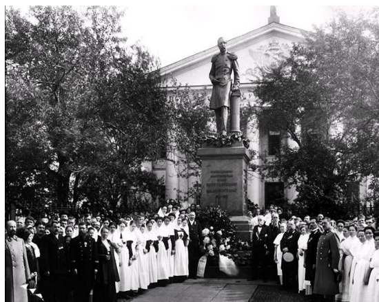
Воспитанники приюта Принца П.Ольденбургского и сестры милосердия у памятника П.Г.Ольденбургскому в день 100-летия со дня его рождения. Фото 1912 г. из фотоателье К.К.Буллы.

В 1889 г. на Литейном проспекте рядом с Мариинской больницей торжественно открыли памятник «Просвещенному благотворителю принцу Петру Георгиевичу Ольденбургскому» (скульптор И.Н.Шредер, архитектор А.О.Томенко). Расходы по сооружению и установке памятника были обеспечены добровольными пожертвованиями. Три фаса пьедестала украшали барельефы: принц Петр беседует с правоведами на экзамене; в больнице у кровати больного ребенка; беседа с девочками-воспитанницами приютов и женских учебных заведений. Памятник уничтожили в 1930 г., а на его месте установили чашу со змеей, в петербургском фольклоре именуемой «памятник теще». В 1912 г., в связи со столетием со дня рождения Петра Георгиевича часть набережной реки Фонтанка в Петербурге была названа «Набережной принца Петра Ольденбургского».