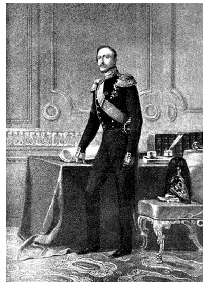
Портрет П.Г.Ольденбургского, висевший в зале младшего курса Училища Правоведения. Иллюстрация из работы: Тегюль М. Принц Ольденбургский и графиня Зарнекау. (Размещена на сайте http://zhurnal.lib.ru в мае 2010 г.)