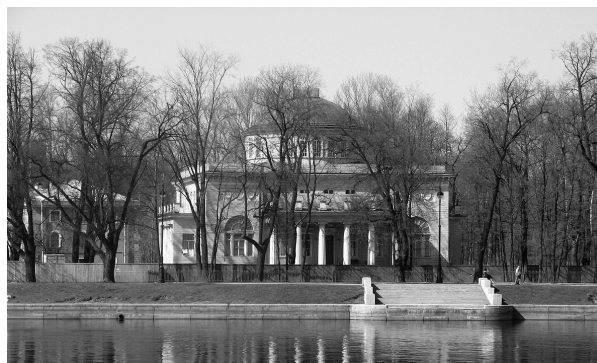
Дворец семьи Ольденбургских на Каменном острове. Апрель 2009 г.

Введение (1864) 7-летнего общеобразовательного курса в женских институтах и гимназиях благодаря реформаторской деятельности П.Г.Ольденбургского сделало женское образование доступным для всех сословий, относительно дешевым, а для бедных бесплатным. Принц активно заботился об улучшении образовательной програм-