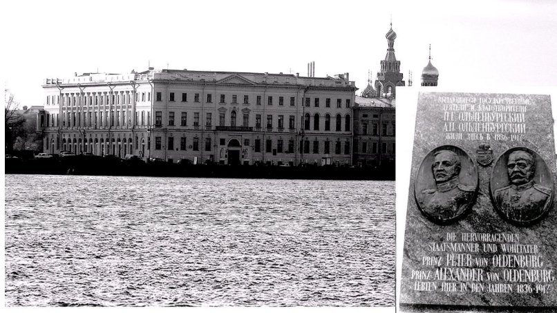
Дворец семьи Ольденбургских в Санкт-Петербурге. Справа – мемориальная доска принцам Ольденбургским. Ноябрь 2010 г.

1 января 1830 г. принц Петр Георгиевич возвращается в Россию 1 , и император жалует ему великолепный дворец 2 , который на 87 лет становится «родовым гнездом» обширной семьи «русских Ольденбургских». Тремя фасадами дворец выходит на Набережную Невы, Летний сад и Марсово поле, оставаясь и в наши дни украшением Санкт-Петербурга. Сегодня здесь находится Университет культуры и искусства, в 2000 г. на здании вновь укреплена мемориальная доска в память, теперь уже двух самых ярких представителей семьи – принцев Петра Георгиевича и Александра Петровича.