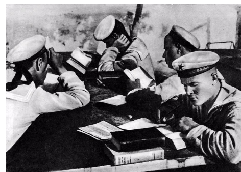
Краснофлотцы на политических занятиях. 1929.

Расхождение интересов правящей партии и большей части общества не оставляло партии другого выхода, как неусыпно контролировать все, что происходит в обществе, и постоянно же воспитывать общество в духе своих идей (всякое умаление социалистической идеологии, с полным основанием подчеркивал В.И. Ленин, есть уступка идеологии буржуазной) – контролировать и воспитывать, естественно, силами своего аппарата и своих членов. А поскольку вооруженные силы обладали особенно большими возможностями свергнуть режим, контролировать и воспитывать их были призваны сразу две партийные структуры – не только объединявшие членов РКП(б)/ВКП(б) и РКСМ/РЛКСМ/ВЛКСМ армейские партийные и комсомольские организации, но и специальные политорганы со штатом профессиональных политработников (вне вооруженных сил создававшиеся – в лице политотделов МТС и политотделов на транспорте – только на особо важных в данный момент «участках социалистического строительства»). Но контролировать и воспитывать личный состав вооруженных сил означало для