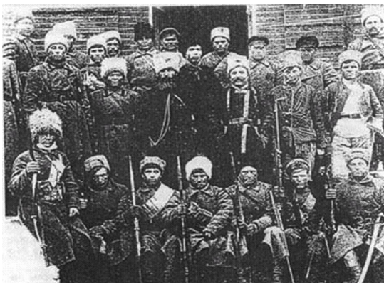
Антоновское восстание 1918–1922 гг. Бойцы одного из полков Объединенной партизанской армии Тамбовского края.