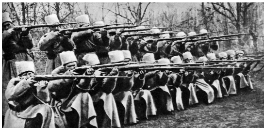
Боевая подготовка частей территориальных войск. 1922 г.