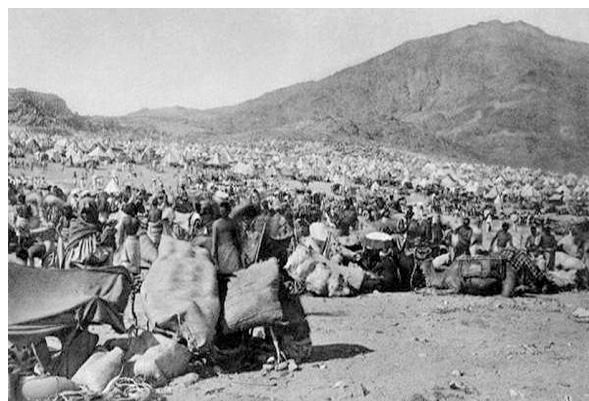
Паломники в долине Мина (слева) и у горы Арафат (справа). Фото конца XIX в.

народом, опасна в санитарно-эпидемиологическом отношении и т.п. Кроме всего прочего, он указывал на главный источник распространения заразы – трупы жертвенных животных, которые тысячами лежали в долине Мина, источая зловонье и гниль на значительные расстояния 1 . Можно считать поразительным тот факт, что столь ужасающее положение дел в «сердце» ислама абсолютно не беспокоило турецкие власти, они даже не делали попыток выправить санитарно-эпидемиологическую в Мекке. Они объясняли его установлениями шариата, согласно которому любая смерть во время хаджа является мечтой паломника, который в этом случае попадает сразу к «престолу Аллаха».