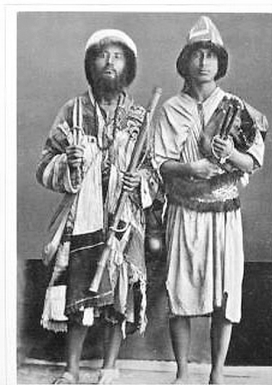
Мусульманские пилигримы. Фото конца XIX в.