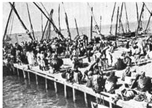
Пристань для выгрузки багажа паломников в Джидде. Фото конца XIX – начала XX вв.

Российские консульства следили за своевременной регистрацией прохождения каждым паломником карантинных мероприятий в установленных международным правом пунктах. Поскольку при прохождении карантина паломники иногда (по разным причинам) теряли свой багаж, то консульства делали все возможное для того, чтобы найти этот багаж и переправить его владельцу. Так, в 1903 г. группа российских паломников оставила в карантинном пункте «Эль-Торо» 8 багажных «мест» (кладей) и уехала. Российскому консульству не без труда удалось найти этот багаж и переправить его в Константинополь, где он был получен владельцами, отчаявшимися вернуть его когда-либо 2 . Достаточно часто российские паломники теряли и свои заграничные паспорта. Поскольку в таком случае их дальнейшее продвижение к святым местам становилось весьма затруднительным (тем более, при вышеуказанной политике турецких властей), то российские консульства выдавали паломникам новые документы, для чего проводилась специальная процедура опознания утратившего свои документы паломника в присутствии 2-х человек, лично его знавших. При этом составлялся специальный протокол секретарем консульства. И заполнялся специальный бланк установленного образца 3 . Хуже обстояло дело с теми, кто утратил деньги.