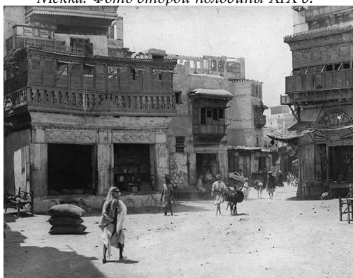
Джидда. Фото конца XIX в.

«преимущественно в покровительстве нашим паломникам» 1 . Консульским работникам рекомендовалось «понимать и разделять их [паломников – В.Л.] нужды, состоя с ними в наиболее близких сношениях» 2 .