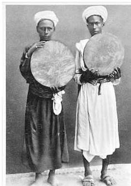
Ибрагимов и Ибрагимов