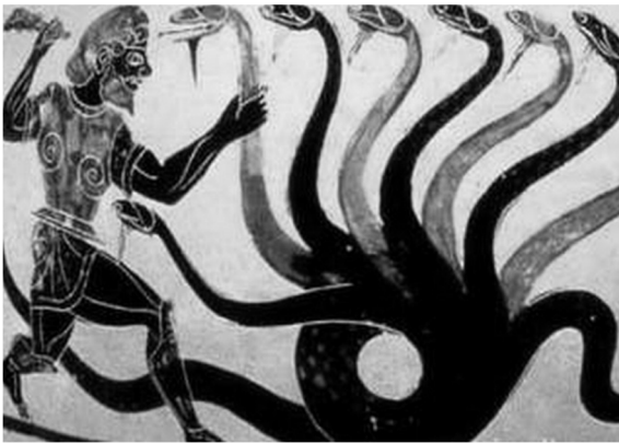
Геракл сражается с Лернейской гидрой. Чернофигурная роспись VI в. до н. э.

I ступень. Источником необузданной природной энергии является хаос, не имеющий образа и поэтому недоступный пониманию человека; с несколько сниженным, но достаточно высоким энергетическим потенциалом связан хтонизм и обладающие меньшей, чем хаос, но значительной энергией хтонические существа, являющиеся определенными образами.