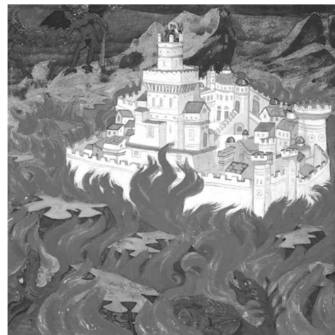
Пречистый град – врагам озлоблене. Художник Н.К. Рерих. 1912

Данное положение имеет глубокий и не всегда очевидный практический смысл. Исходя из этого, в частности, оптимальное взаимодействие человеческой разумной деятельности и девственной природы в целях обеспечения устойчивого экологического развития должно предполагать наличие не