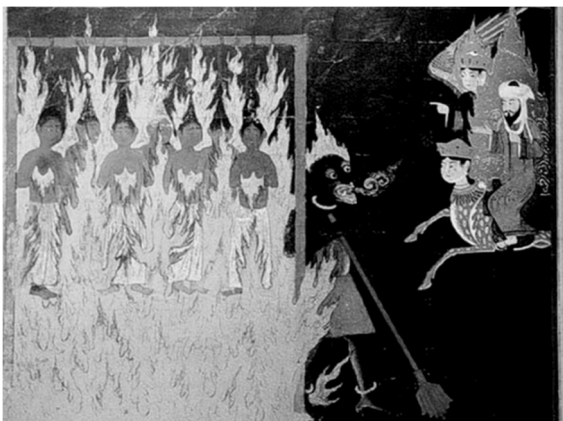
Пророк Мухаммед посещает ад. Персидская миниатюра из «Мирадж-наме». XV в.