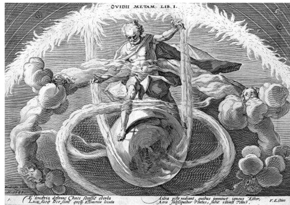
Упорядочивание Хаоса, или создание четырех стихий. Гравюра Х. Гольциуса к «Метаморфозам» Овидия. 1589

Хаос – неоплодотворенная разумом бесформенность, но обязательная для полноты бытия, без которой космос обесмысливается. Хаос – это разверзшаяся бездна Земли, порождающая темную, лишённую созидательного начала дикую природную силу – хтонические (от др. греч. χθών – земля, почва) существа, олицетворяющие неразумную мощь Земли 7 .