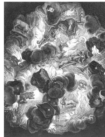
Хаос, или сотворение мира. Гравюра Б. Пикара. 1733