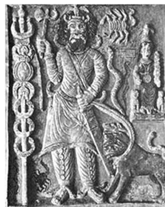
Нергал, хтоническое божество шумеро-аккадской мифологии, владыка подземного царства