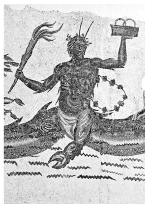
Форкий, древнегреческое морское хтоническое божество

Начало становления взаимодействия космоса и хаоса как самое начало придания темной мощи хаоса какой-то структуры связано с появлением хтонических существ, олицетворяющих собой дикую природную мощь земли, связь с хаосом, подземным царством и сочетающих сверхъестественные способности с отсутствием созидательного начала. К хтоническим существам традиционно относятся, например, гады, оборотни, различные чудовища. Сама Земля в некоторых культурных традициях представляла как хтоническое существо: леса и растительность – шерсть, воды – кровь и т.д. Хтонический период, включающий этапы фетишизма и анимизма, а также героический этап «развития мифа», по классификации Лосева 2 ,