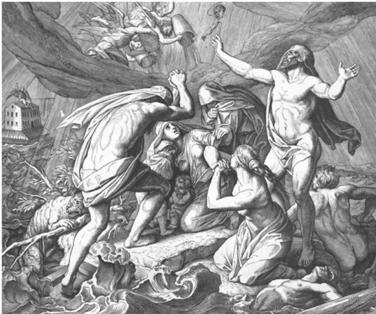
Потоп. Иллюстрация к Ветхому завету Ю. Шнорра фон Карольсфельда. 1852–1860

То, что Лосев называет «хтони́змом», включает некое переплетение фетишистских (как безраздельное отождествление вещи с духом вещи) и анимистических представлений (как отделение вещи от ее идеи, т.е. духа вещи), возникших из предшествующего «хаотически переплетенного, спутанного и нерасчлененного» нечто, где «все вещи и явления представляются исполненными беспорядочности, диспропорции и дисгармонии, доходящей до прямого уродства и ужаса» 1 . Хтонический период отражает первичную ступень творения мира из праматерии (хаоса). В качестве следующей ступени выступает героический период, который начинается с того, что герои противостоят духам (демонам) и чудовищам хтонического периода 2 .