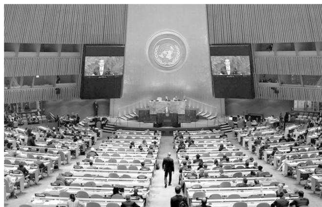
Генеральная Ассамблея ООН принимает проект резолюции, призывающей к немедленному и полному выводу из Приднестровья российских военных, входящих в состав миротворческих сил. 22 июня 2018 г.

Что касается президента И. Додона, то в данном случае он однозначно высказался в поддержку проводимой на Днестре миротворческой операции. Президент выразил уверенность в том, что «вопросы такого значения, как вывод российского военного контингента, а также вывоз (утилизация) вооружения и боеприпасов, нужно обсуждать с легитимным парламентом Республики Молдова и легитимным правительством, которые будут сформированы в ближайшие месяцы, по итогам парламентских выборов» 4 .