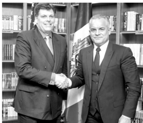
Председатель Демократической партии Молдовы Вл. Плахотнюк с Б. Бирманом, заместителем администратора Агентства США по международному развитию (USAID) по Европе и Евразии. Май 2018.

В последнее время политическая жизнь Молдовы характеризуется усилением не только антироссийской риторики, но и соответствующих практических действий. Если ранее проевропейские партии Молдовы, пришедшие к власти в 2009 г., по крайней мере, в своей актуальной политике стремились придерживаться относительно сбалансированного подхода в отношениях с ЕС и Россией (с последней, прежде всего, по экономическим соображениям), то в настоящее время ситуация резко изменилась.