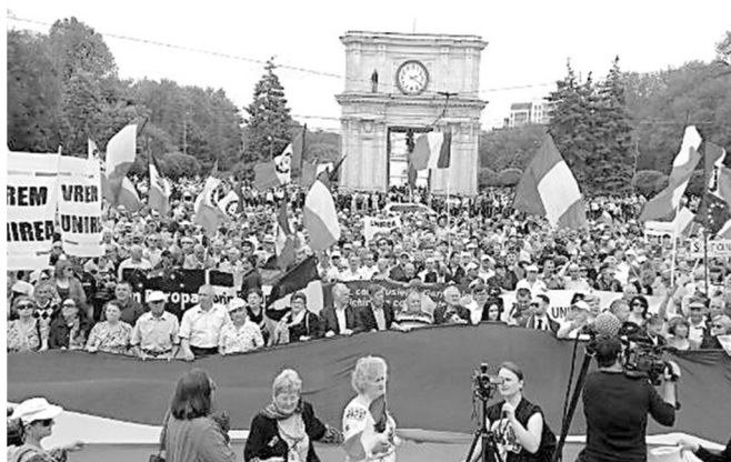
Начатая 23 сент. 2018 г. Либеральной партией кампания «В год столетия – подписывайте Заявление об объединении Республики Молдова с Родиной-Матерью Румынией».

В образовательной сфере Молдовы, помимо изучения истории румын (написанной в Бухаресте), в ближайшее время предполагается внедрить обязательную доуниверситетскую программу по изучению румынского языка и литературы, а также ряда социальных наук (истории, географии) в интерпретации румынских специалистов.