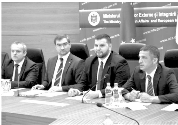
Заседание Консультативного совета по СМИ Республика Молдова – Румыния. Май 2016.

Одновременно с дискриминацией русскоязычных СМИ активную экспансию в информационное пространство Молдовы осуществляют США и ЕС, прежде всего Румыния. В настоящее время уже порядка десяти средств массовой информации Молдовы в той или иной степени занимаются пропагандой унионистских идей. В частности, из румынского бюджета финансируется телеканал TVR Moldova и радио Chişinău. В ближайшее время должен начать вещание телеканал Unirea («Унирия»), ориентированный на открытое продвижение в республике идей унионизма.