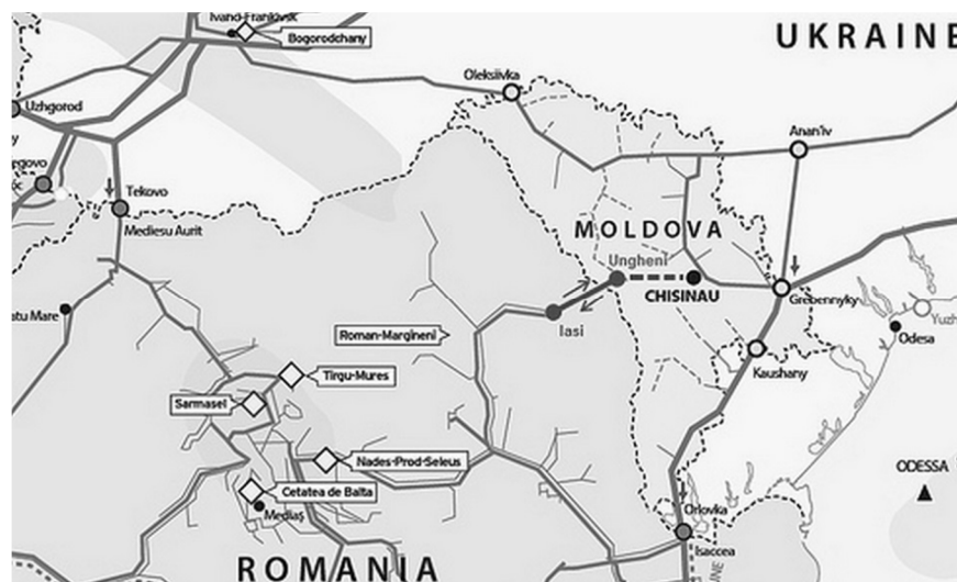
Газопровод Яссы – Унгены – Кишинёв, соединяющий газотранспортные системы Румынии и Молдовы. Карта с сайта https://news.finance.ua/ru/news/-/307216/diversifikatsiya-po-moldavski-primer-dlya-ukrainy

Ухудшение политического спектра российско-молдавских отношений сопровождается стремлением Кишинёва всячески ослабить свою экономическую зависимость, прежде всего энергозависимость, от России. Речь идет, в первую очередь, о форсировании строительства молдавско-румынского газопровода Яссы – Унгены – Кишинёв (при финансовой поддержке Румынии и ЕС), используя который Молдова намерена закупать газ не только в Румынии, но и на газовых рынках ЕС. Напомним, что уже в настоящее время со стороны Румынии действует линия газопровода Яссы – Унгены. Трубопровод по молдавской территории до Кишинёва должен стать её продолжением. Проект будет реализовывать румынская компания Transgas, приобретая с этой целью активы молдавского Vestmoldtransgas.