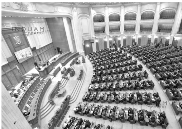
Торжественное заседание румынского парламента в день 100-летней годовщины со дня объединения Бессарабии и Румынии 27 марта 2018 г.

27 марта, в день 100-летней годовщины со дня присоединения, состоялось торжественное заседание румынского парламента с приглашением на заседание молдавских депутатов. С трибуны парламента была зачитана «Торжественная декларация о праздновании Объединения Бессарабии с Родиной-матерью Румынией, которое состоялось 27 марта 1918 года» 3 . Как известно, в молдавском парламенте, правительстве, Конституционном суде немало представителей власти, имеющих, помимо молдавского, румынского гражданства и оказывающих скрытую или явную поддержку румыно-унионистскому проекту. В этом смысле выглядит вполне закономерным, что 31 октября 2017 г. Конституционный суд (КС) Молдовы дал положительное заключение по законопроекту группы депутатов-демократов о внесении в Конституцию поправки, предусматривающей изменение названия государственного языка с «молдавского» на «румынский» 4 .