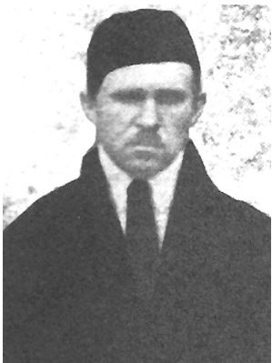
Якуб Меметович Якуб Кемаль (1887–1938), тюрколог и арабист; историк, филолог, музейный работник

основу информации об ориенталисте, опубликованной в подготовленном в С.-Петербургском филиале Института востоковедения РАН биобиблиографическом издании «Люди и судьбы» 1 .