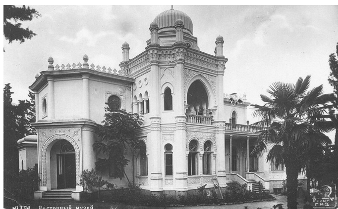
Ялта. Восточный музей. Фото 1920-х гг.