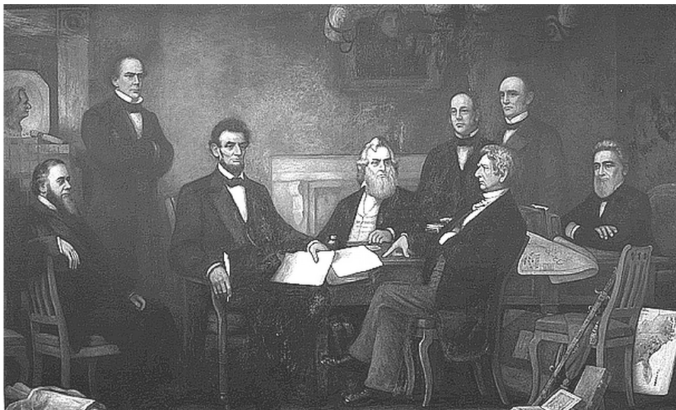
Чтение Прокламации об освобождении негров Президентом Линкольном. Художник Ф.Б.Карпентер. 1864

доктор политических наук, кандидат философских наук, проректор по научной работе Академии права и управления