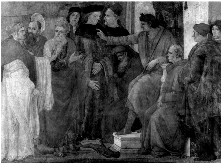
Диспут апостолов Петра и Павла с магом Симоном перед Нероном. Фреска. Художник Филиппино Липпи. 1481–1482.