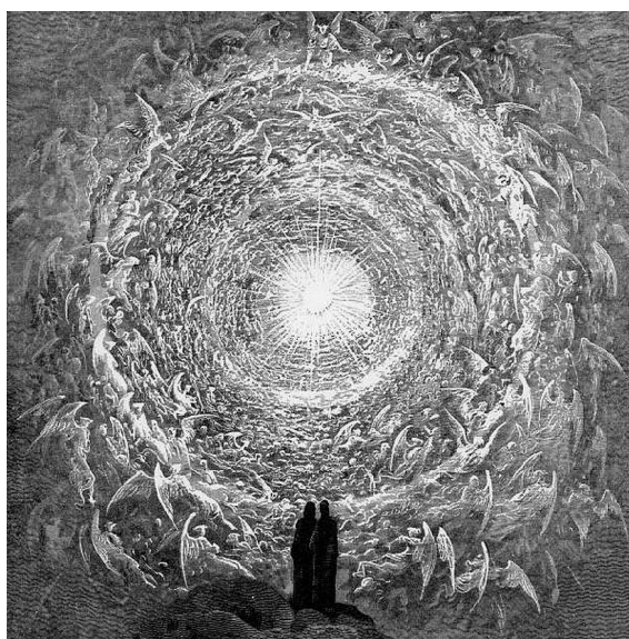
Иллюстрация к «Божественной комедии» Данте Алигьери. Рай. Художник Гюстав Доре. Фрагмент. 1872.