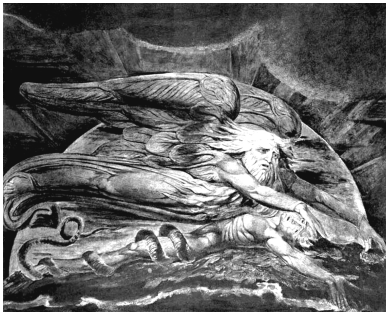
Элохим, сотворяющий Адама. Художник Уильям Блейк. 1795.