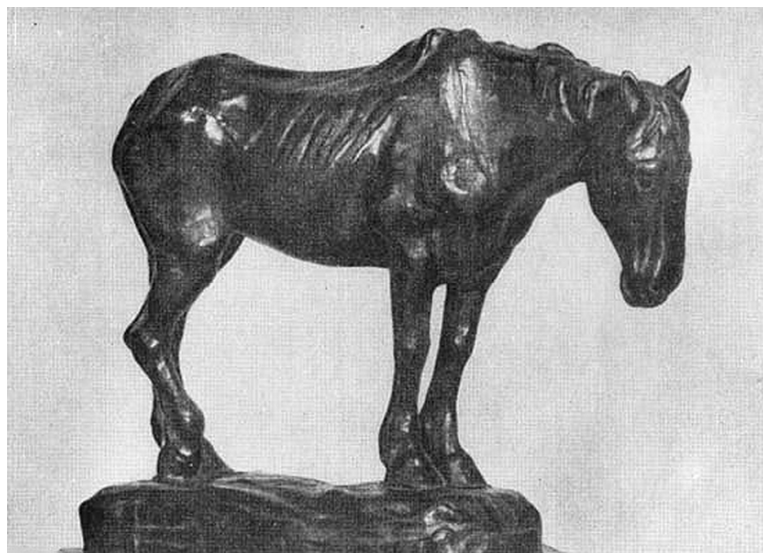
Старая лошадь. Скульптура Константина Менье. 1880-е гг.