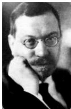
Василий Васильевич Зеньковский (1881–1862), русский филолог, богослов, педагог.