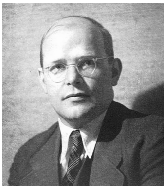
Дитрих Бонхёффер (Dietrich Bonhoeffer, 1906–1945), немецкий лютеранский пастор и теолог, антифашист.

Это действительно идеал, соответствующий христианским принципам, а не утопия. Это не теократия власти, а теократия духа. Не государство, используя свою власть, подчиняет себе общество на основе христианских принципов (на примере католичества мы видим, что при этом сразу происходит извращение христианских принципов), а, напротив, оно само трансформируется в христианское.