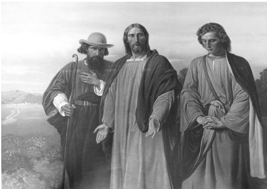
Путь в Эммаус. Художник Отто Менгельберг. Вторая половина XIX в.