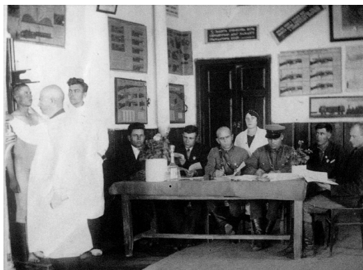
Призыв в РККА (Куртамыш, 1940).

А в 1936 г. – когда вместо рабочих в военные школы решили, наконец, широко вовлекать учащуюся молодежь – проблем с набором не возникло, желающих стать курсантами оказалось в 10 раз больше, чем вакансий! Правда, «огромную роль в деле комплектования военных школ» в том году сыграли введение в конце 1935-го персональных воинских званий и новой формы одежды и повышение командсостава зарплаты 8 . Улучшение внешнего вида военных стало соблазнять даже рабочих! Среди желающих стать курсантами, докладывал 20 июля 1936 г. помощник начальника Орловской бронетанковой школы по политической части бригадный комиссар А.И. Александров, «канди-