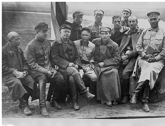
Слева: Московские командные курсы РККА (фото 1920-х гг.); справа: Быково. На учениях красных командиров (фото 1925 г.)

Однако рабочие кадровыми командирами, как правило, становиться не желали! «Подбор поступающих по классовому признаку, – отмечалось в составленном в Главном управлении РККА (ГУ РККА) обзоре состояния РККА в 1927–1928 гг., – затрудняется слабой тягой в военные школы рабочей молодежи из числа индустриальных рабочих и партийцев. <...> Основные причины: слабая материальная обеспеченность комсостава (не главная причина) по сравнению с нормами зарплаты на производствах, отсутствие быстрого продвижения по службе и неограниченное служебное время при строгом служебном и неслужебном режиме» 1 .