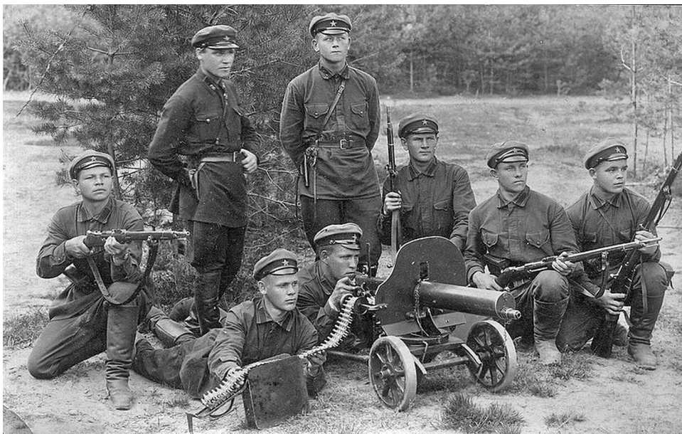
Командиры и бойцы РККА. Фотография 1930 г.