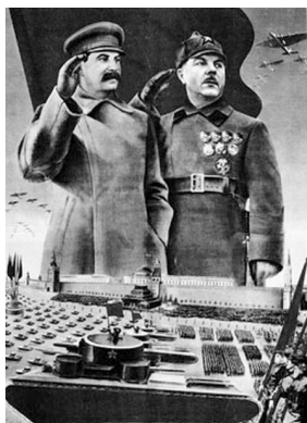
Плакат «Да здравствует рабоче-крестьянская Красная Армия – верный страж советских границ!». Художник Г.Г. Клуцис. 1935